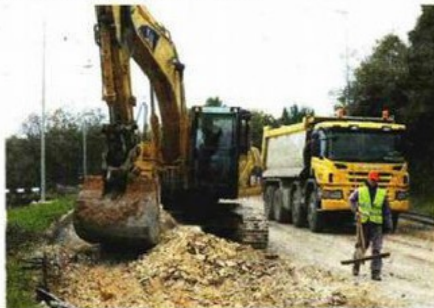
Bageri na ulazu u Zelenu lagunu