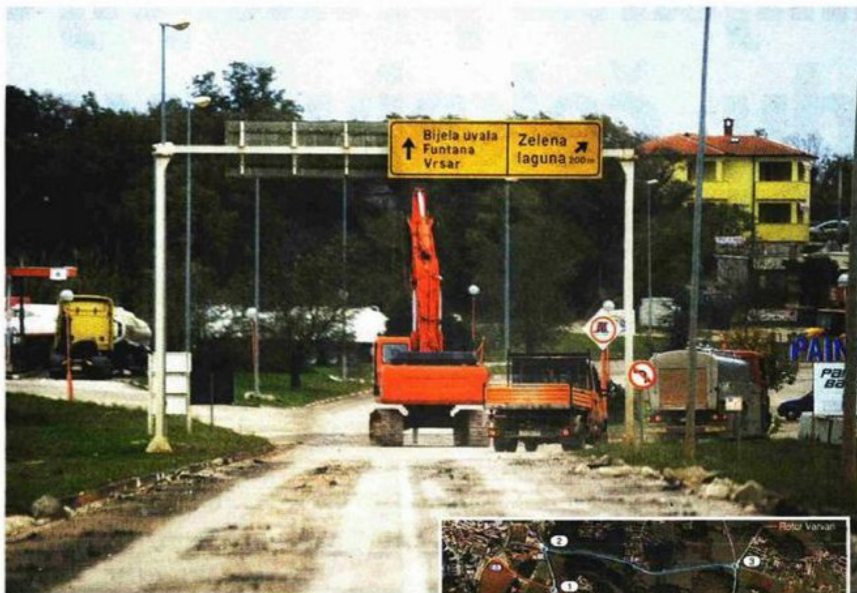
Započeti radovi na rekonstrukciji državne ceste D75 na dionici Žatika-Zelena laguna

nije Somogy i obrnuto, dok se za potrebe ulaza i izlaza iz turističkog naselja Brulo otvorio privremeni prolaz u nastavku Končarove ulice.