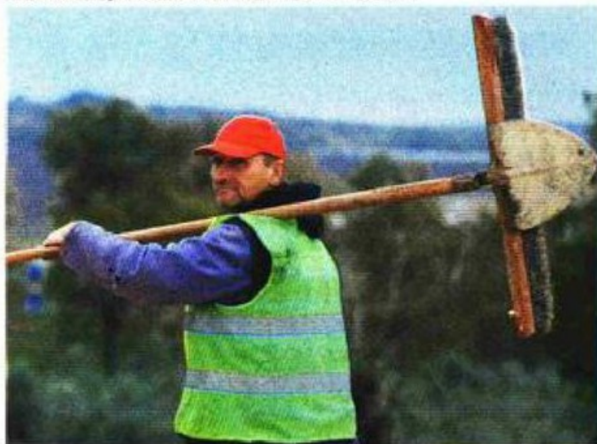
Radnik na cesti

U turističko naselje Plava laguna ulazi se i izlazi preko turističkog naselja Brulo i parkirališta hotela Diamant, te cestom koja paralelno uz glavnu cestu vodi do ceste u naselju Plava laguna. Ulaz i izlaz u turističko naselje Zelena laguna odvija se kroz raskrižje za Bijelu uvalu na cesti Poreč-Funtana. Za stanare