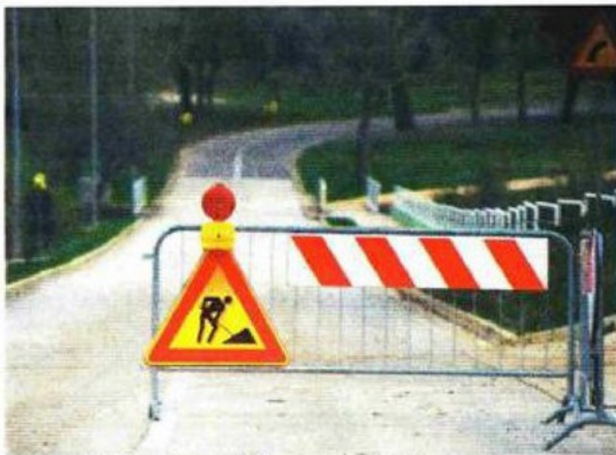
Zatvorena prilazna cesta za Zelenu lagunu